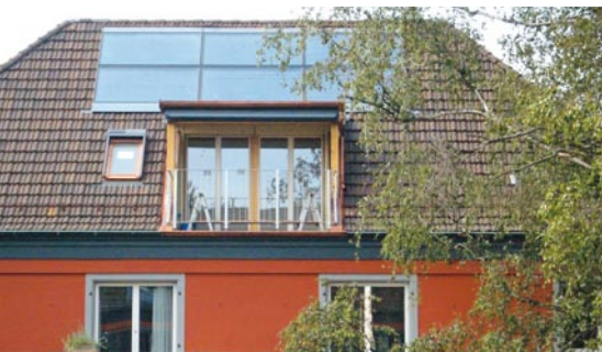
Solaranlagen senken den Energieverbrauch.