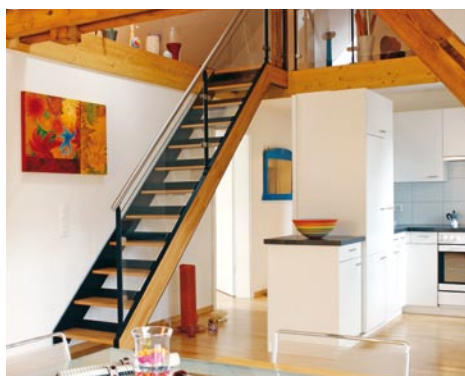
In den Dachstöcken ist stimmungsvoller Wohnraum entstanden. Blick in eine Dreizimmerwohnung an der Winterthurerstrasse.

Daneben finden sich viele weitere Kombinationen. So bieten verschiedene Häuser neu geschaffene Dachmansarden oder Büro-/Bastelräume im Keller, die hinzumietet werden können. Trotz des Ausbaus müssen die Mieter nicht auf den meist unabdinglichen Stauraum verzichten, denn ganz bewusst wurde ein Teil der Keller- und Estrichräume nicht ausgebaut. An der lärmigen Winterthurerstrasse dagegen, die für Familien weniger geeignet ist, erstellte man im Dachstock eigenständige Wohnungen, die zumeist zwei Zimmer umfassen und sich gegen die ruhige Hofseite orientieren.